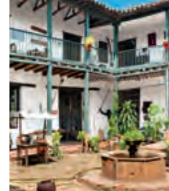
Patio de la casa Patio del Moro