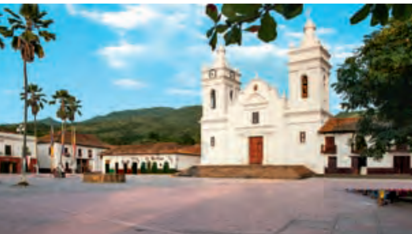
Catedral San Miguel Arcángel

San Miguel de Guaduas fue declarado Bien de Interés Cultural en el año 1959.