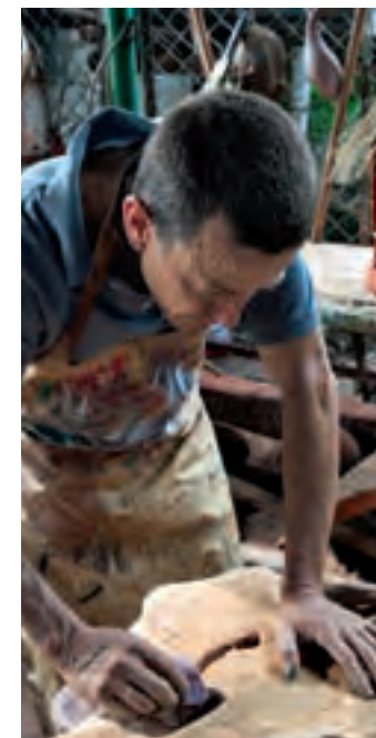
Artesano de la madera

En la arquitectura característica de Guaduas predominan las puertas y ventanas en madera pintadas en su mayoría de color verde. Cuentan que la casa en donde se encuentra el Patio del Moro fue la primera de la Villa y funciona allí el museo de Artes y Tradiciones de Guaduas.