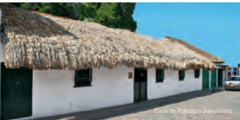
Casa de Policarpa Salavarrieta