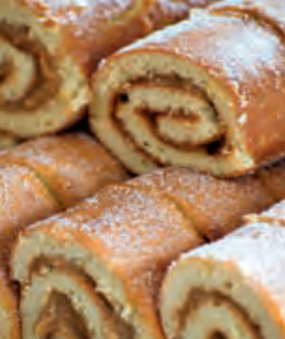
Brazo de reina