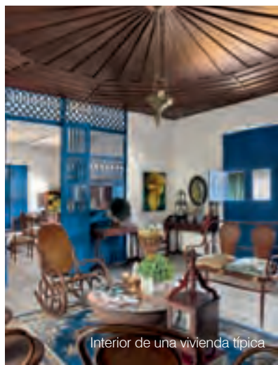
Interior de una vivienda típica

• En el Parque Principal encontrará artesanos que trabajan la guadua.