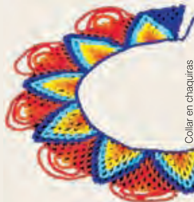
Collar en chaquiras

En el resguardo indígena Emberá-Chamí, Karmata Rúa, a unos 10 km del casco urbano de El Jardín en la vía que comunica a este municipio con Andes, los artesanos de la comunidad tejen hermosos diseños en chaquiras; collares, manillas, bolsos y cinturones, entre otros. Sus artesanías también se pueden adquirir en los toldos del parque central.