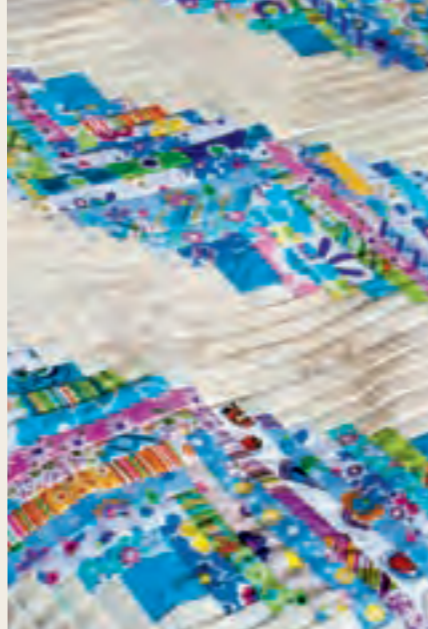
Colchas de retazos