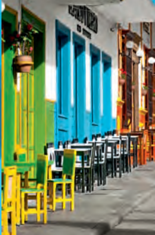
Arquitectura Parque El Libertador

El Jardín fue declarado Bien de Interés Cultural en el año 1985.