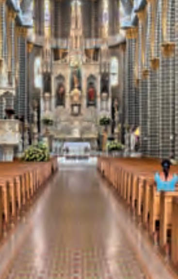
Basílica de la Inmaculada Concepción