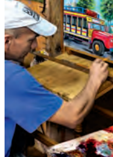
Artesano pintando taburetes

Los taburetes son asientos muy básicos, sin apoyabrazos y hechos de madera. En la cultura antioqueña han sido empleados principalmente en las fondas, cafés, restaurantes y bares. En El Jardín algunos artesanos se dedican a decorar el espaldar de cuero crudo, con ingeniosas y bonitas pinturas que representan las costumbres paisas. El trabajo es totalmente hecho a mano, desde la construcción de la pieza en madera de monte, hasta la pintura que es dibujada al óleo.