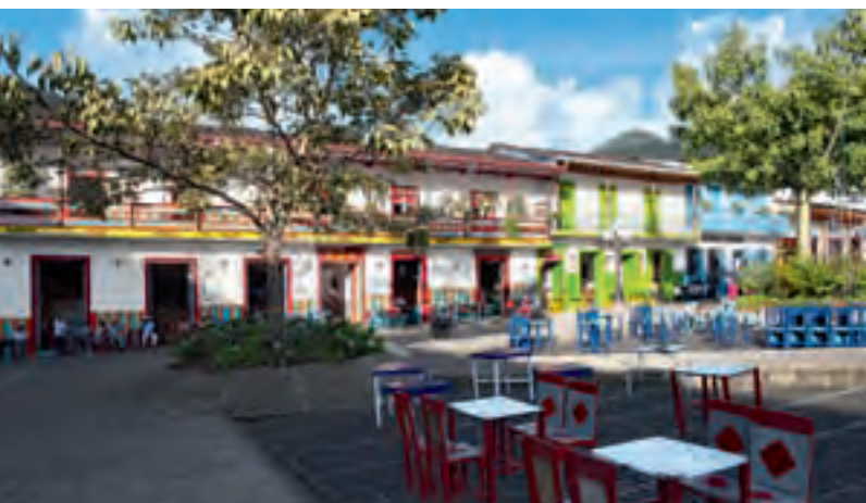
Parque El Libertador

La arquitectura tradicional antioqueña está representada fielmente en las lindas casas con puertas de colores y ventanas con chambranas. Resaltan en sus fachadas los colores vivos que hacen de El Jardín un pueblo alegre y siempre bello.