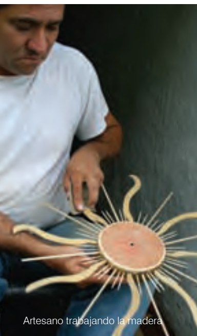
Artesano trabajando la madera

“Los saberes del ebanista que es leyenda se plasman hoy en la puerta, la ventana y el balcón. El consagrado tallador moderno no quiere dejar ningún mal detalle suelto, sabe que es heredero de un saber hecho arte y tradición”.