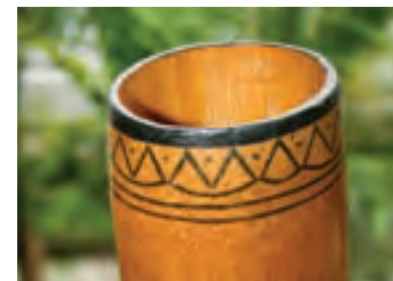
Artesanía en guadua

En el Eje Cafetero abundan los cultivos de guadua, una planta renovable que los artesanos aprovechan para convertir en floreros, lámparas, licoreras, cofres y bomboneras. Así mismo, distintas clases de madera, además de utilizarse en construcción y muebles, también se requieren para la elaboración de pequeños objetos como llaveros y utensilios de cocina.