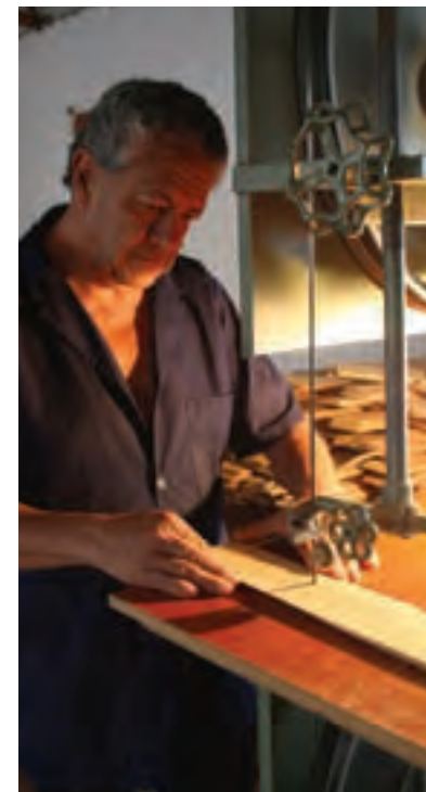
Artesano trabajando la madera