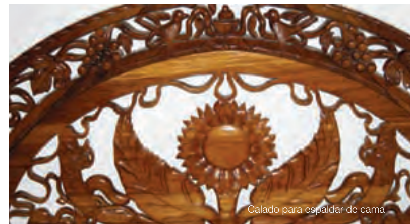
Calado para espaldar de cama