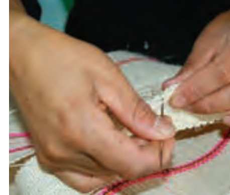
Tejido en fique

Aprecie los extensos cultivos de la planta que se encuentran antes de llegar a Salamina. Allí se lleva a cabo todo el proceso, desde el corte de la penca y el desfibrado, hasta el tejido de bolsos, carteras, cinturones, individuales y manteles, objetos que se podrán adquirir en las tiendas artesanales.