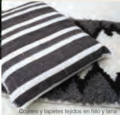
Cojines y tapetes tejidos en hilo y lana