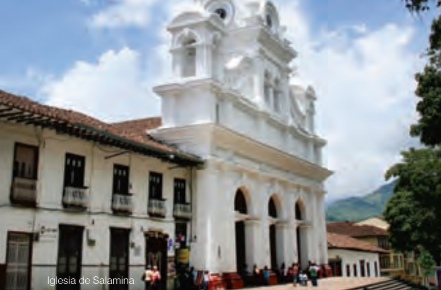
Iglesia de Salamina