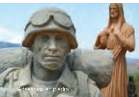
Artesanías en piedra