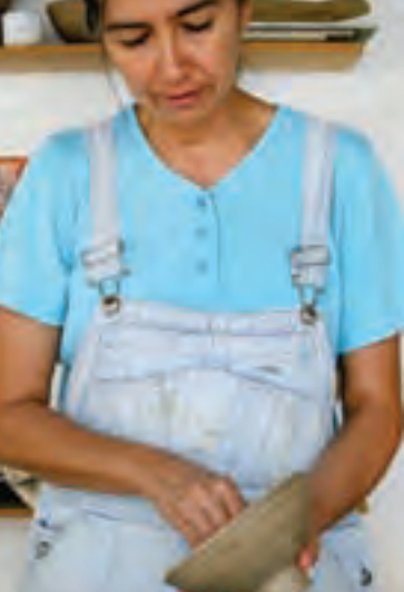
Artesana trabajando en cerámica