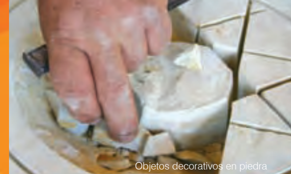
Objetos decorativos en piedra

La principal actividad artesanal de Barichara es el trabajo en piedra, transmitido por generaciones.