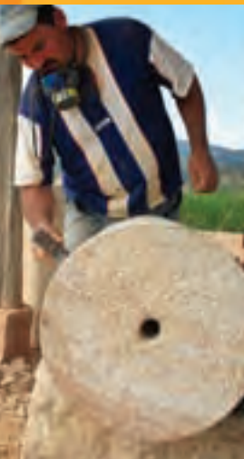
Artesano trabajando la piedra

Reconocida por su arquitectura colonial, Barichara es un lugar ideal para el descanso y el turismo cultural.