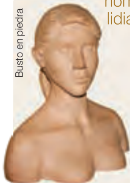
Busto en piedra

Las rocas se extraen de las canteras cercanas y en las cuales moldean fuentes, imágenes religiosas, figuras de animales, mesas de comedor, así como cuerpos humanos y juegos de ajedrez con fichas del tamaño de una persona. La creatividad de estos labradores no tiene límites cuando bocetan y se valen de los punteros, las buzardas, las macetas y las pulidoras, algunas de las herramientas utilizadas.