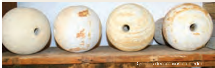
Objetos decorativos en piedra

Muchos de los más veteranos artesanos de la piedra coinciden en haber sido discípulos de José Antonio Figueroa, más conocido como Pablo Picapiedra, uno de los precursores de tan estimable y arriesgado oficio, y quien es recordado en el pueblo por sus magníficas obras y porque sembró la idea de que no hay imposibles cuando se esculpe la piedra. Las esculturas de los picapiedras de Barichara adornan jardines, salas, iglesias y parques, no solo de la localidad, sino de muchos lugares en Colombia y el mundo.