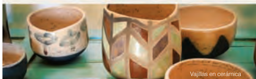
Vajillas en cerámica