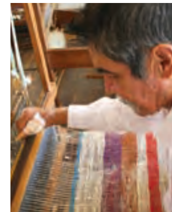
Artesano elaborando telas en fique

La tejeduría es un oficio ejercido por abuelos baricharas y las nuevas generaciones que se capacitan en la Fundación Escuela Taller. Los viejos trabajan en la casa histórica de Aquileo Parra y en telares artesanales urden las telas de fique con las que elaboran tapetes, costales y mochilas. Son característicos los bolsos guane en hilos de algodón y los bordados de ropa y cotizas hechos por los alumnos de la escuela - taller. Visite también la Fundación San Lorenzo donde el fique es la materia prima para la fabricación de papel, collares, pulseras, agendas, tarjetas y bisutería.