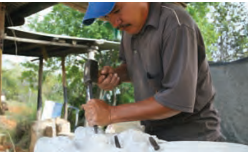
Artesano trabajando la piedra