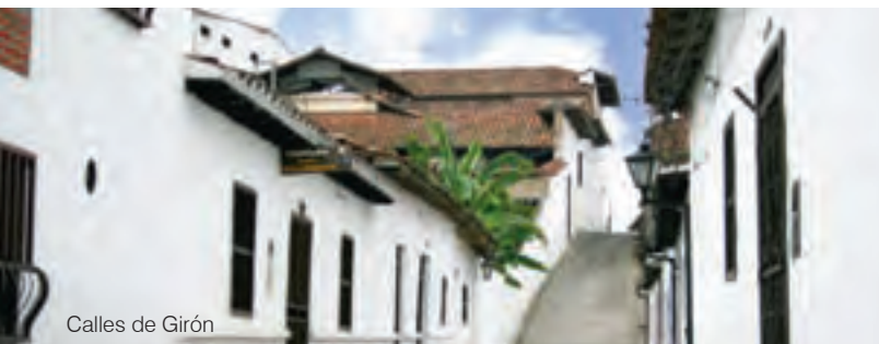
Calles de Girón

Girón fue fundada en 1631 y desde aquella época se ha mantenido el interés por la conservación de sus tradiciones, su arquitectura y su historia. Se mantienen en pie grandes casonas coloniales, calles empedradas, faroles, paredes muy blancas, puentes de calicanto y una fervorosa identidad religiosa, manifiesta en hermosas iglesias. San Juan de Girón es conocida como la Ciudad blanca o la Villa de los caballeros, en la que por muchos años el cultivo del tabaco ha sido la principal actividad e inspiración artesanal.