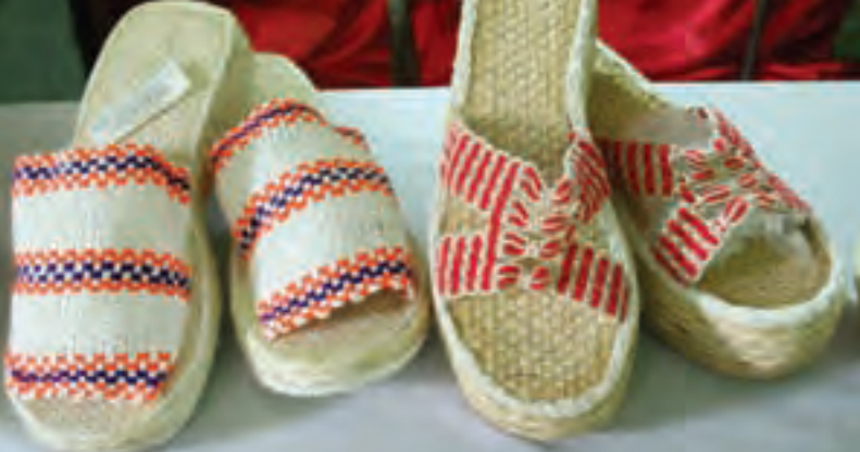
Sandalias en fique