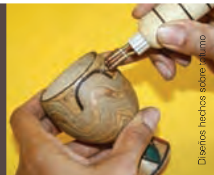
Diseños hechos sobre totumo

Estas materias primas se convierten en vasijas, floreros, fruteros, copas, licóceras y llaveros. La decoración de los objetos es hecha con pinturas y labrados en técnica de pirograbado.