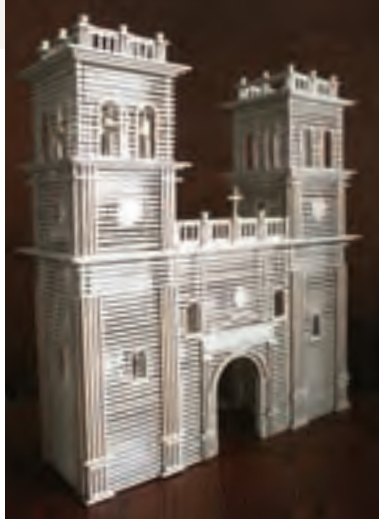
Réplica de la iglesia de Girón

Las imágenes más representativas de Girón son motivo permanente de los artífices reflejado en cuadros, llaveros, portallaveros y varias clases y formas de utensilios y elementos decorativos.