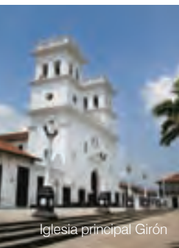
Iglesia principal Girón

La mayoría de artesanos tiene sus talleres en barrios retirados del centro histórico, por eso, suelen congregarse los domingos en la plazuela de las Nieves (calle 28 entre carreras 27 y 28), mientras que en la casa de la cultura se ha creado una vitrina permanente de exhibición y venta. La sede de la Cámara de Comercio, costado oriente del parque principal, es un punto clave de información sobre los artesanos y sus productos.