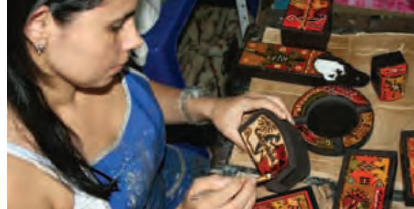
Artesanías en madera