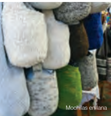
Mochilas en lana

En las calles 13 y 12, o en la calle Caliente, que fuera en tiempos de la Colonia centro fragoroso de lupanares y ventas de chicha, hoy convergen muchos de los artesanos que realzan el paisaje con prendas de lana, de cuero, cuadros pintados, joyas y tallados, o con exclusivas formas de la marroquinería. Los artesanos también están a la entrada del pueblo, en Monquirá, en la casa de la cultura o en las zonas rurales.