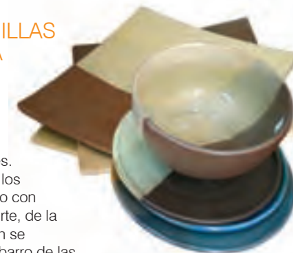
Vajillas en cerámica

Los talleres están retirados del área urbana, pero usted tiene acceso a los objetos de barro que se venden en la plaza de mercado y los almacenes. El trabajo en arcilla es legado de los antepasados indígenas y un oficio con arraigo en la región del Alto Ricaurte, de la que Villa de Leyva hace parte. Aún se encuentran alfareros que usan el barro de las minas de la región. Hay barro blanco, amarillo, rojo, lila o negro; sin embargo, los rojos y amarillos son los más comunes por la docilidad que adquieren, debido a sus características químicas y físicas.