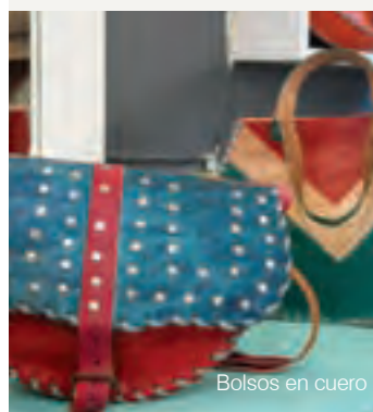
Bolsos en cuero