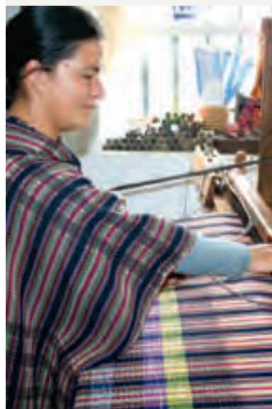
Artesana trabajando en telar

La ruana confeccionada 100% de lana virgen es la prenda artesanal más representativa de Villa de Leyva.