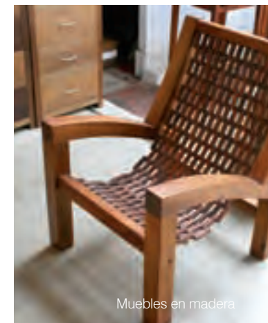
Muebles en madera

En Villa de Leyva sabrá de la calidad de objetos hechos con pino, cedro y maderas industriales. Dichas materias primas son las más recurrentes, y aunque los artesanos suelen elaborar objetos como portarretratos, cofres, baúles y joyeros, Villa de Leyva se reconoce más por el trabajo de los ebanistas que diseñan muebles para el hogar. En muchos de ellos se utilizan técnicas como el calado en tonos naturales.