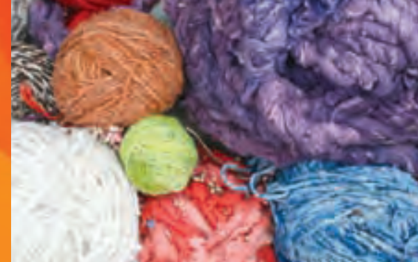
Diferentes tipos de lana

No hay límite en la variedad de colores y texturas para los tejidos elaborados de manera artesanal