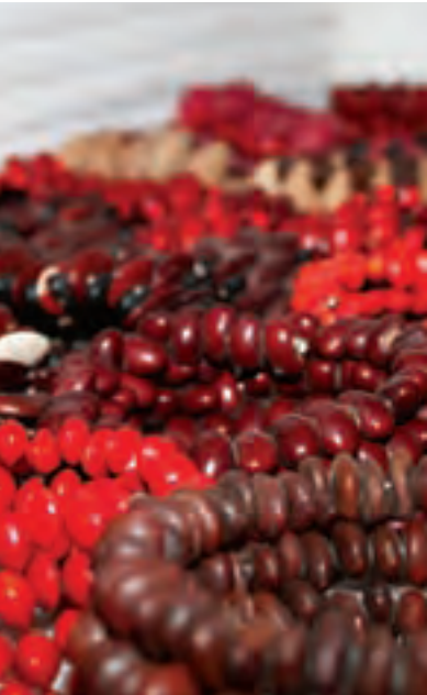
Bisutería hecha con semillas

En bisutería y ornamentos, cada vez son mayores las propuestas: semillas naturales, papel y materiales reciclables son transformados en llamativos accesorios. Admire la capacidad de quienes ven un producto en materiales que cualquiera descartaría.