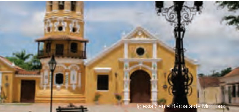
Iglesia Santa Bárbara de Mompox