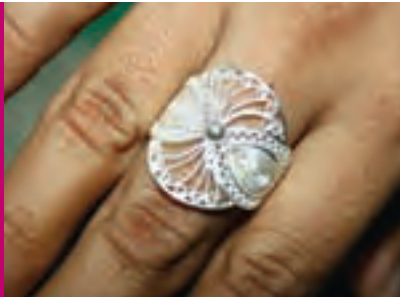
Anillo en filigrana

“De hilos casi que invisibles, a veces áureos y muchas argentados, con su pinza en mano el pertinaz orfebre se dispone a moldear la pequeña rosa o los secretos increíbles de su imaginación”.