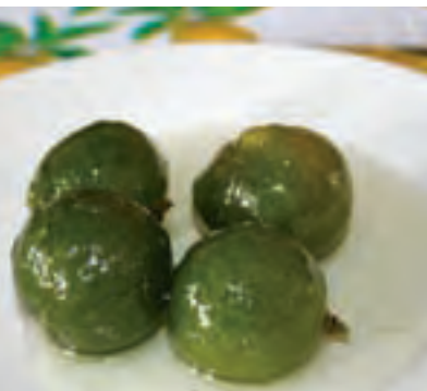
Dulce de limón