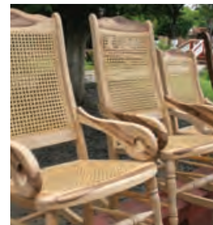
Mecedoras en madera

Los ebanistas suelen decir que con la madera no hay límites. En Mompox podrá darse cuenta de la variedad de muebles que se labran con trozas de roble y cañahuate. Y son las mecedoras el símbolo de esta clase de trabajo artesanal reconocido en Colombia y el mundo. De estas sillas, que ahora se tejen con paja sintética, hay distintas clases: la tradicional, la imperial y la Mompox 450 años. Cualquiera que le guste, los artesanos buscan los medios para enviársela.