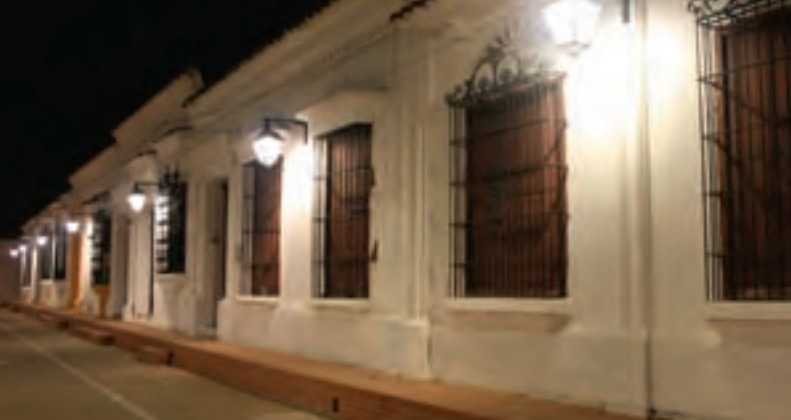
Arquitectura de Mompo

“De hilos casi que invisibles, a veces áureos y muchas argentados, con su pinza en mano el pertinaz orfebre se dispone a moldear la pequeña rosa o los secretos increíbles de su imaginación”.