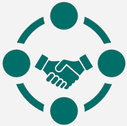
Rueda de Negocios